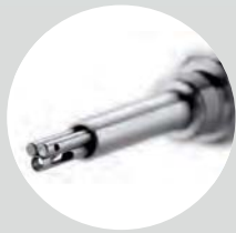
Speciale Pitot per misure di portata