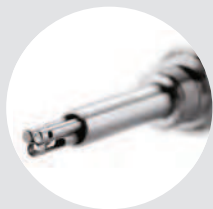
Speciale Pitot per misure di portata